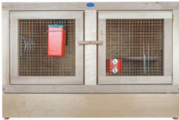
Käfig enthält separat erhältliche Ausstattung